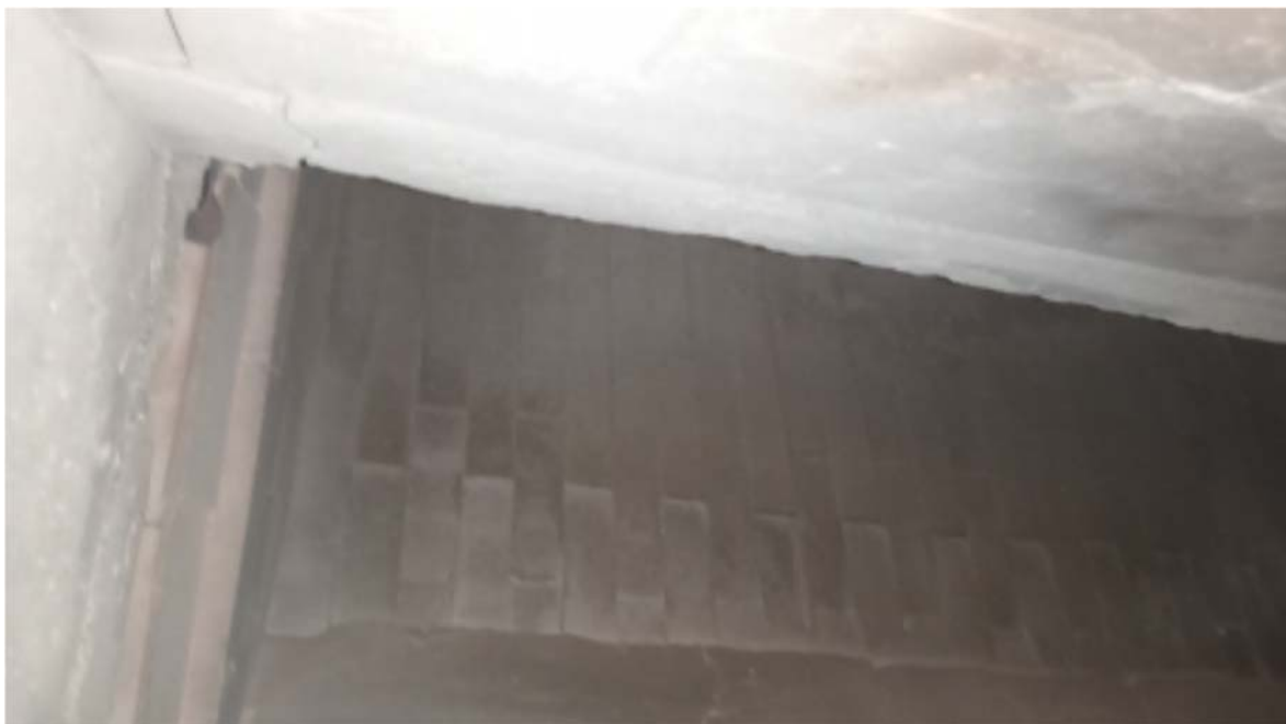
FOTO 07 MELHORIAS TÉCNICAS NO INTERIOR DA FORNALHA