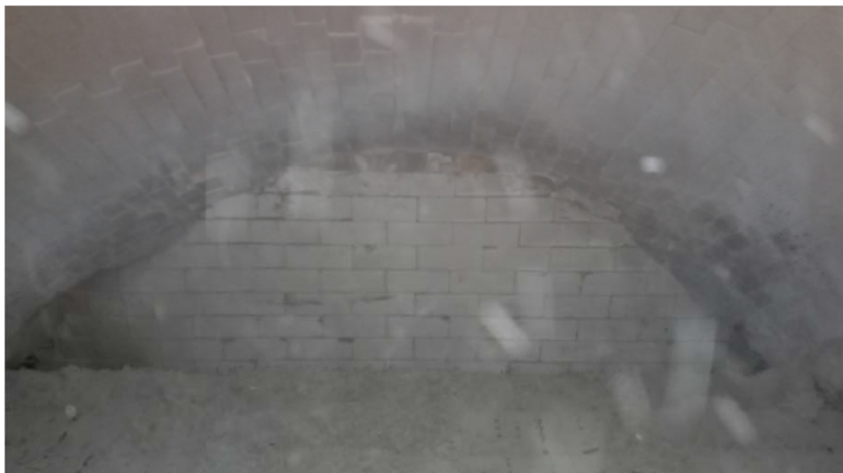
FOTO 08 MELHORIAS TÉCNICAS NO INTERIOR DA FORNALHA.