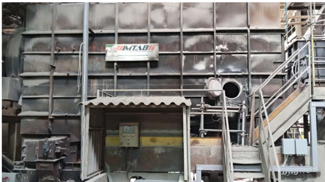
FOTO 05 BV DE ACESSO DA FORNALHA