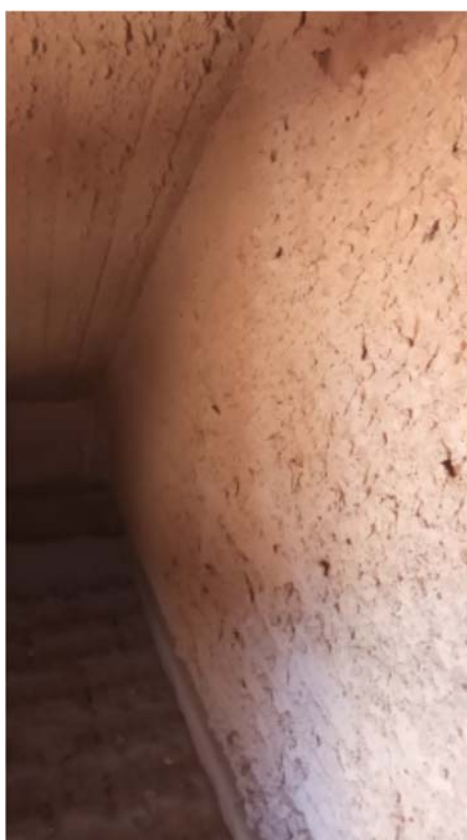
FOTO 06 MELHORIAS TÉCNICAS NO REVESTIMENTO REFRAATÁRIO NA REGIÃO DO PISO.