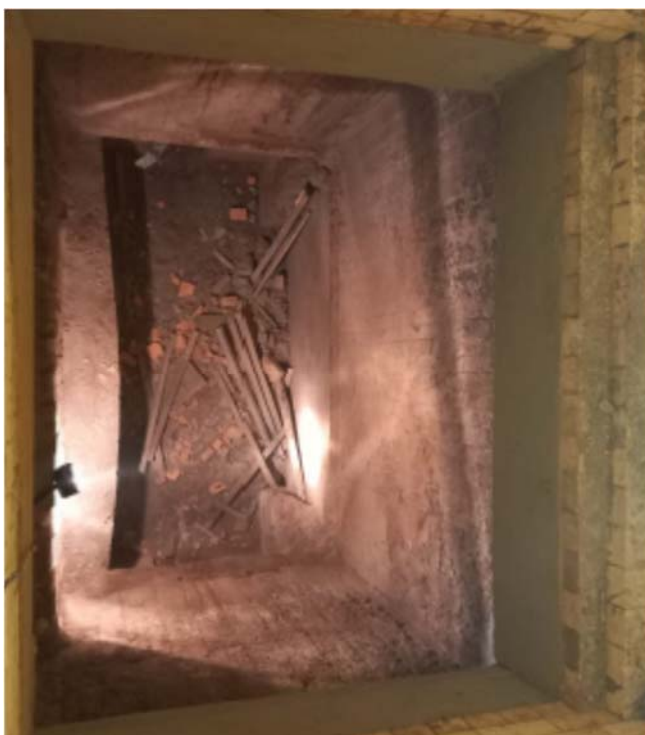
FOTO 02 INSTALAÇÃO DE REVESTIMENTO REFRAATÓRIO NA REGIÃO INFERIOIR DA CAPELA.