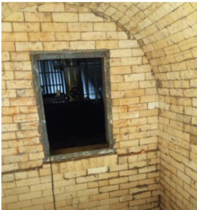
FOTO 01 INSTALAÇÃO DE REVESTIMENTO REFRAATÓRIO NA CAPELA.