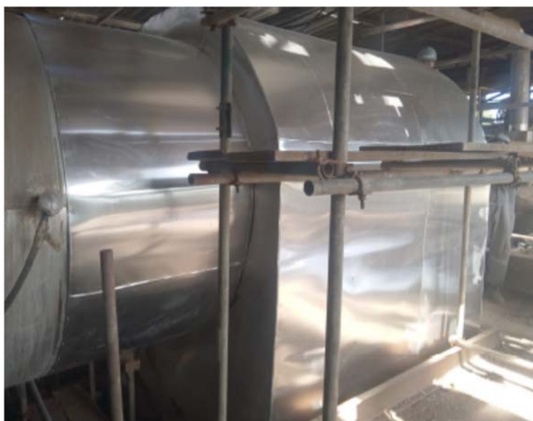
FOTO 06 INSTALAÇÃO DE ISOLAMENTO TÉRMICO NA CAPELA.