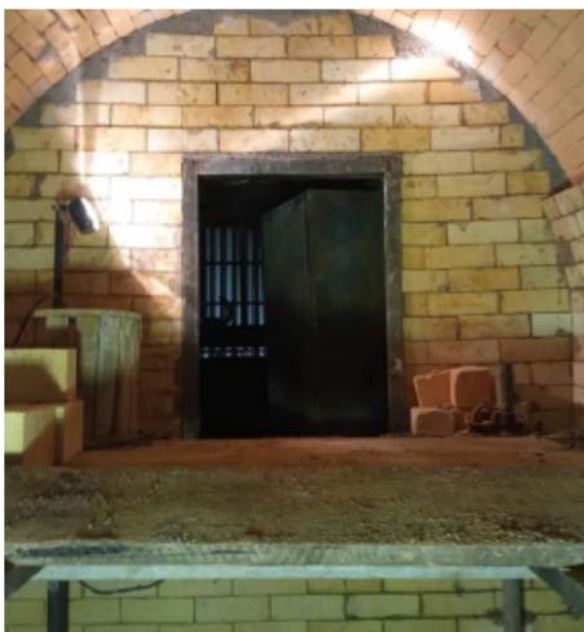
FOTO 04 INSTALAÇÃO DE REVESTIMENTO REFRAATÓRIO NA CAPELA.