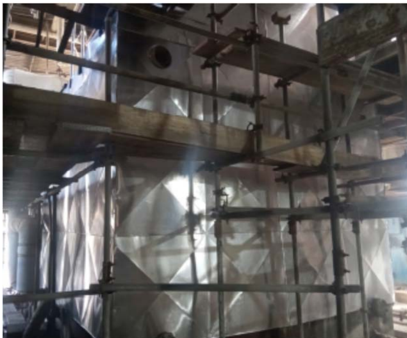
FOTO 05 INSTALAÇÃO DE ISOLAMENTO TÉRMICO NA FORNALHA.