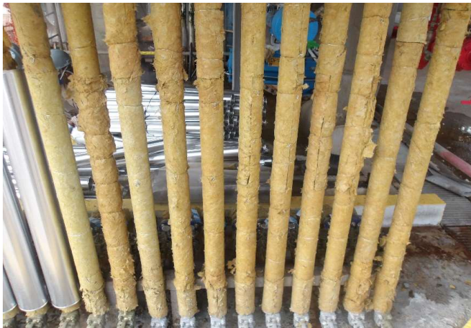
Instalação do novo isolamento.