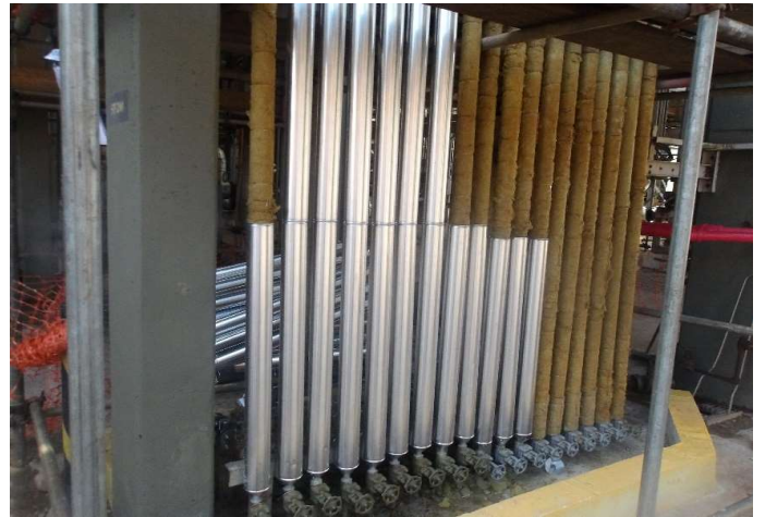
Início da instalação da proteção mecânica.