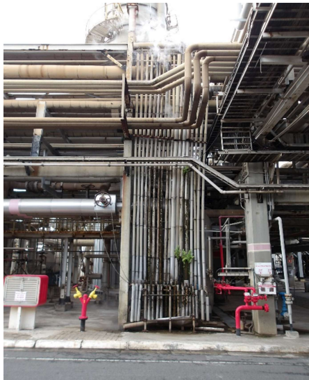
Bateria ST-200 Sul antes da intervenção.