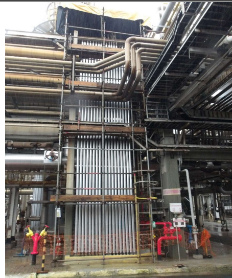
ST-200 Sul após conclusão do isolamento e chapa de proteção mecânica.