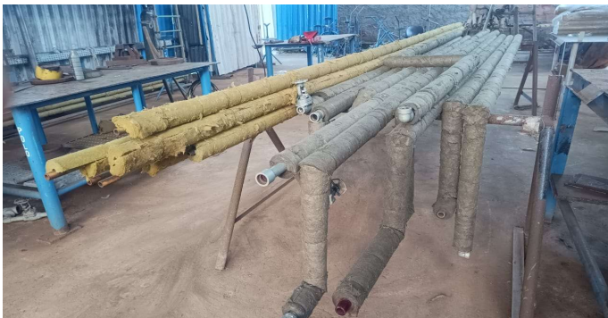
Isolamento de linhas de 1" nas instalações da empresa de caldeiraria.