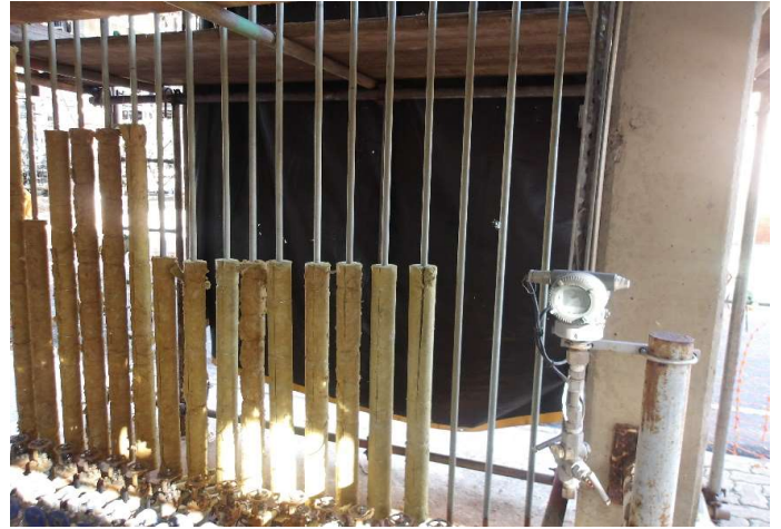
Instalação do novo isolamento.