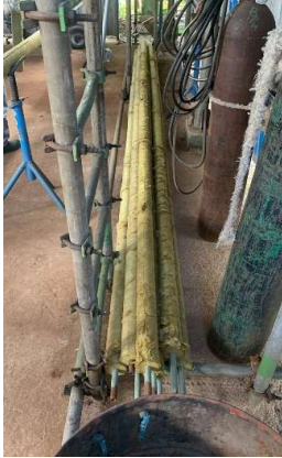
Isolamento de linhas de 1/2" nas instalações da empresa de caldeiraria.