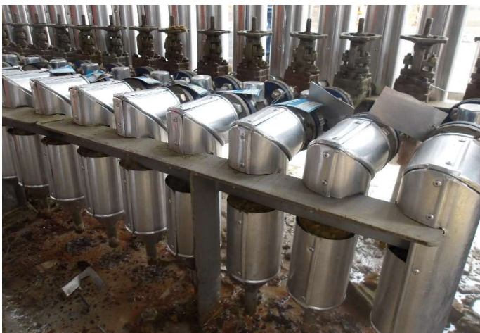
Instalação da proteção mecânica nos suportes