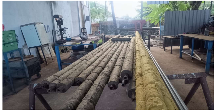
Isolamento de linhas de 1" nas instalações da empresa de caldeiraria.